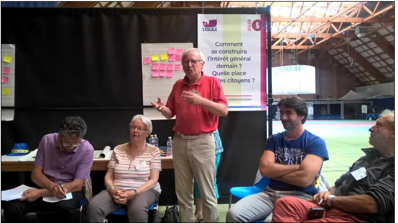
AG de la FCSE, Dunkerque 2018