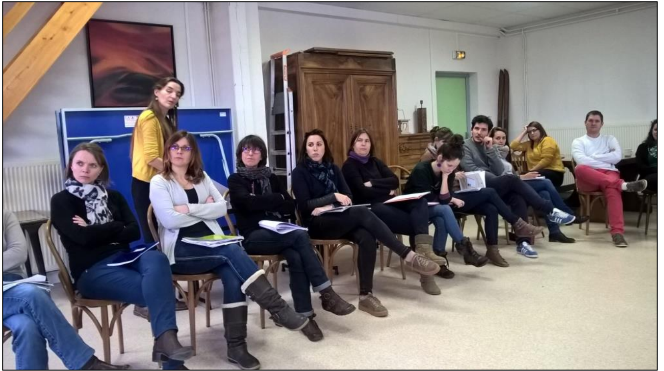
FAVE 2018, le Poizat