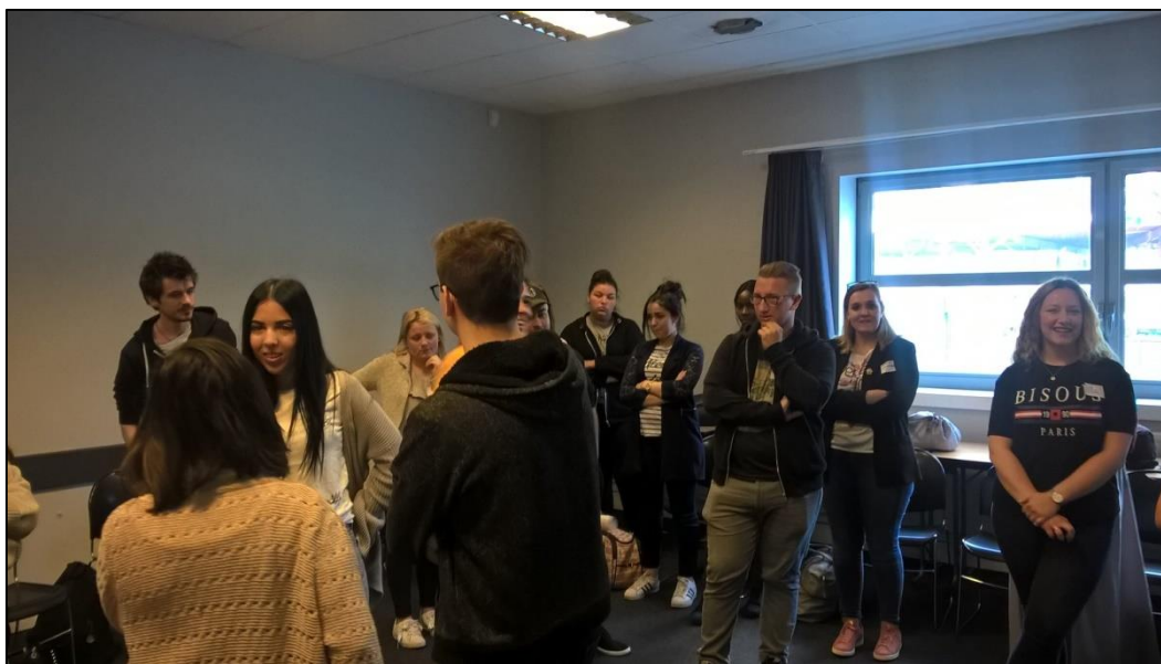
Formation civique et citoyenne, Lyon juin 2018

► Appui méthodologique à la mise en place d'une commission territoriale « jeunesse » par le centre social CESAM de Miribel en lien avec la Communauté de communes Miribel le Plateau.