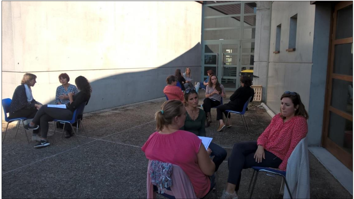
Formation kawaa au CS Artémis, octobre 2018

► Organisation et animation de 3 « kawaa » sur les préjugés et les amalgames dans le cadre du Forum Accueils Collectifs des Mineurs (ACM) sur la « Diversité », organisé par la DDCS.