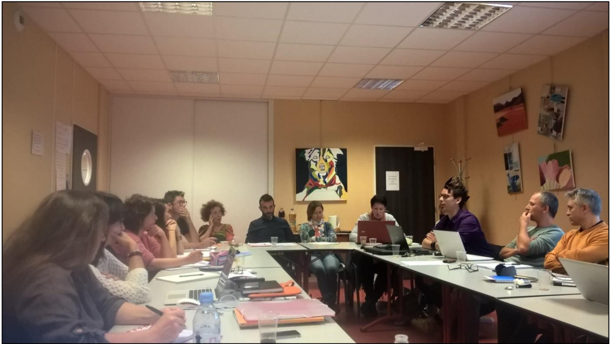
Comité des directeurs, Arpent octobre 2018