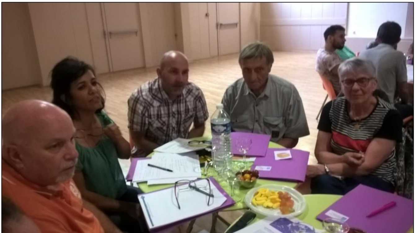
AG FDCS Ain, CS Thoissey, juin 2018