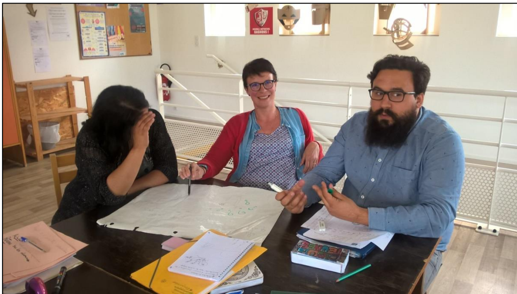
Commission enfance, CS Hauteville, 2018