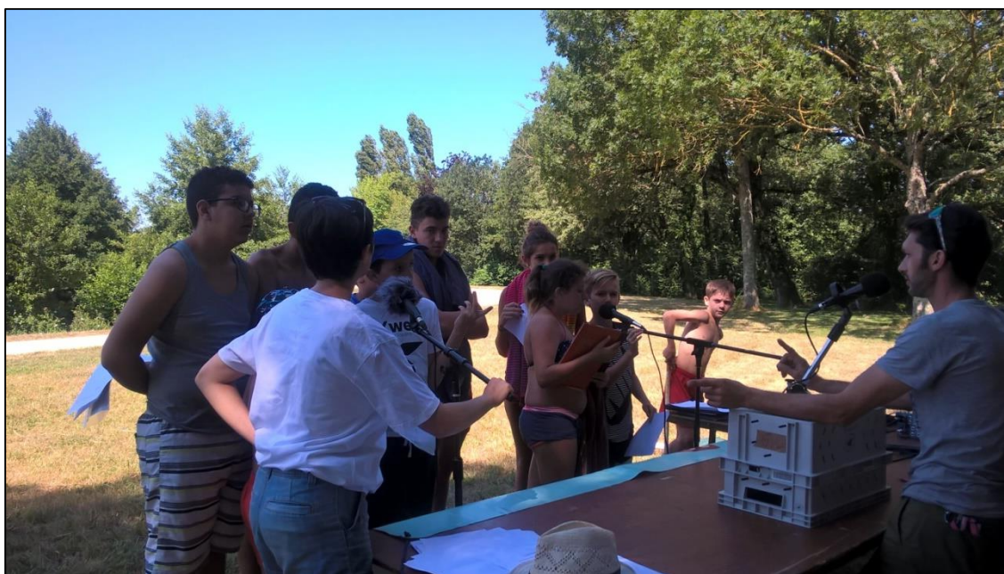
Bouvent, juillet 2018

Un évènement sportif qui regroupe une centaine de jeunes de 11 à 18 ans. Il s'agissait d'inclure une épreuve faisant appel à la réflexion et à l'expression libre autour d'un thème : « Egalité garçons/filles » à travers le sport. Action réalisée en partenariat avec la Ville de Bourg et Radio B. Un montage radiophonique a été réalisé par Radio B et a été diffusé lors du Forum ACM 2018.