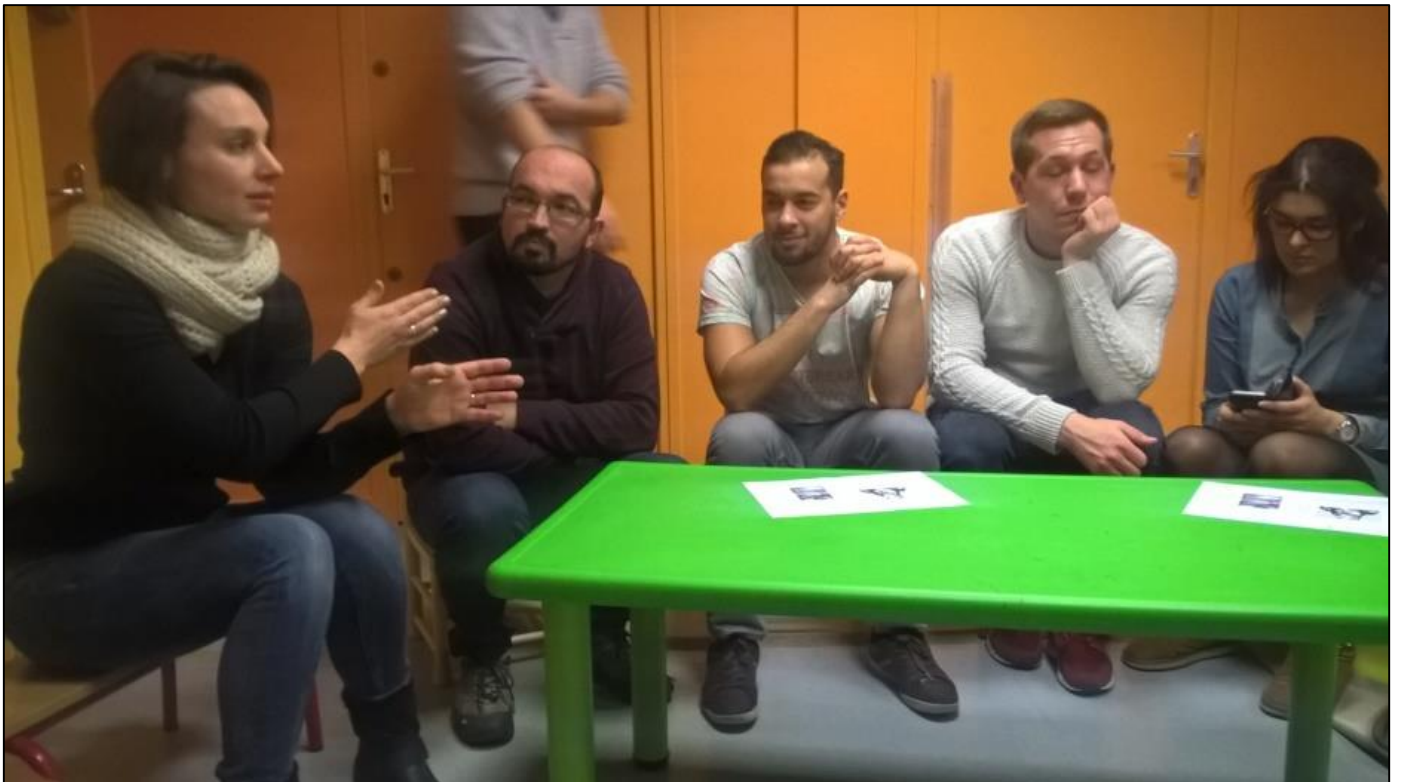
CCommission jeunesse, CS Thoisy, janvier 2018