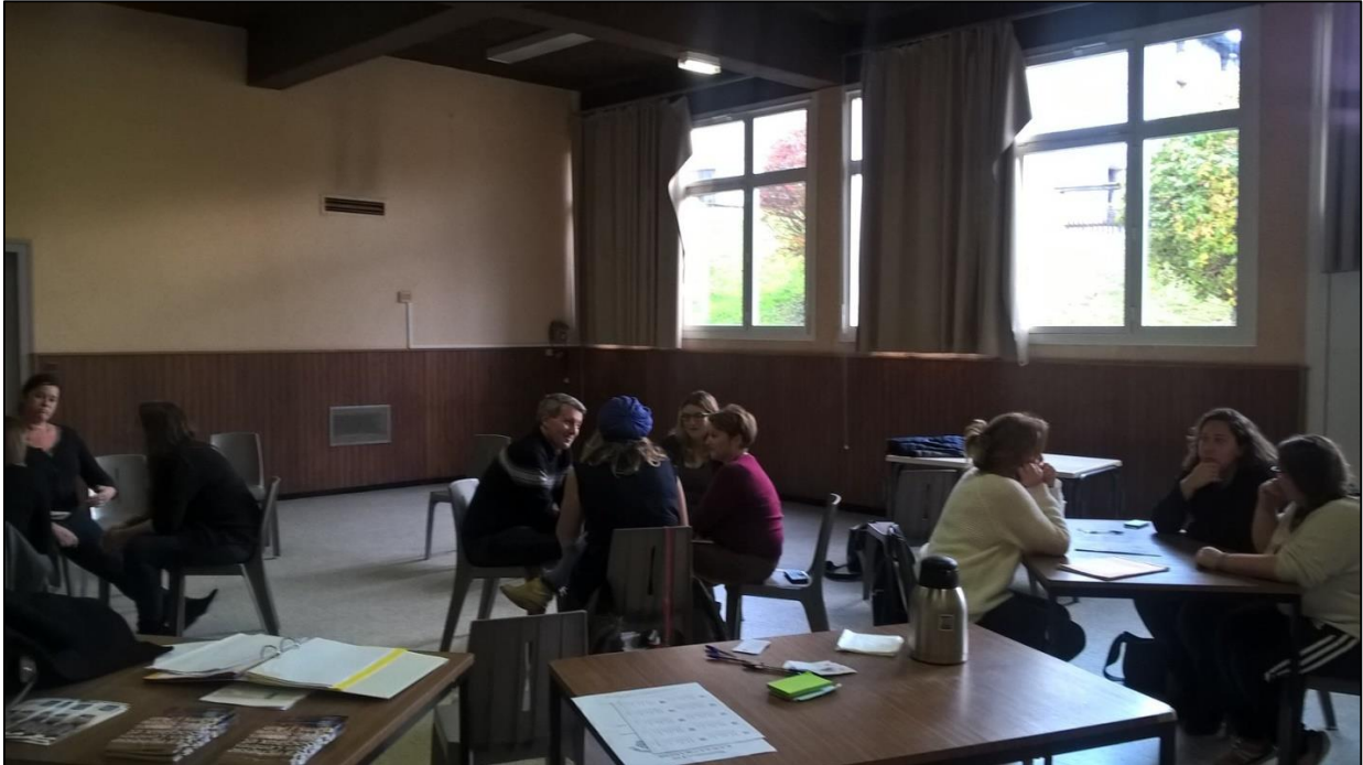
Forum ACM, novembre 2018