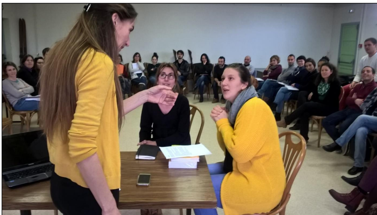
Formation actions collectives à visée émancipatrice, Poizat 2018

► Contribuer à la prévention des risques de tensions : appui au toilettage des statuts, des délégations, à la clarification de la place et du rôle de chacun, temps de travail autour de la gouvernance des centres sociaux.