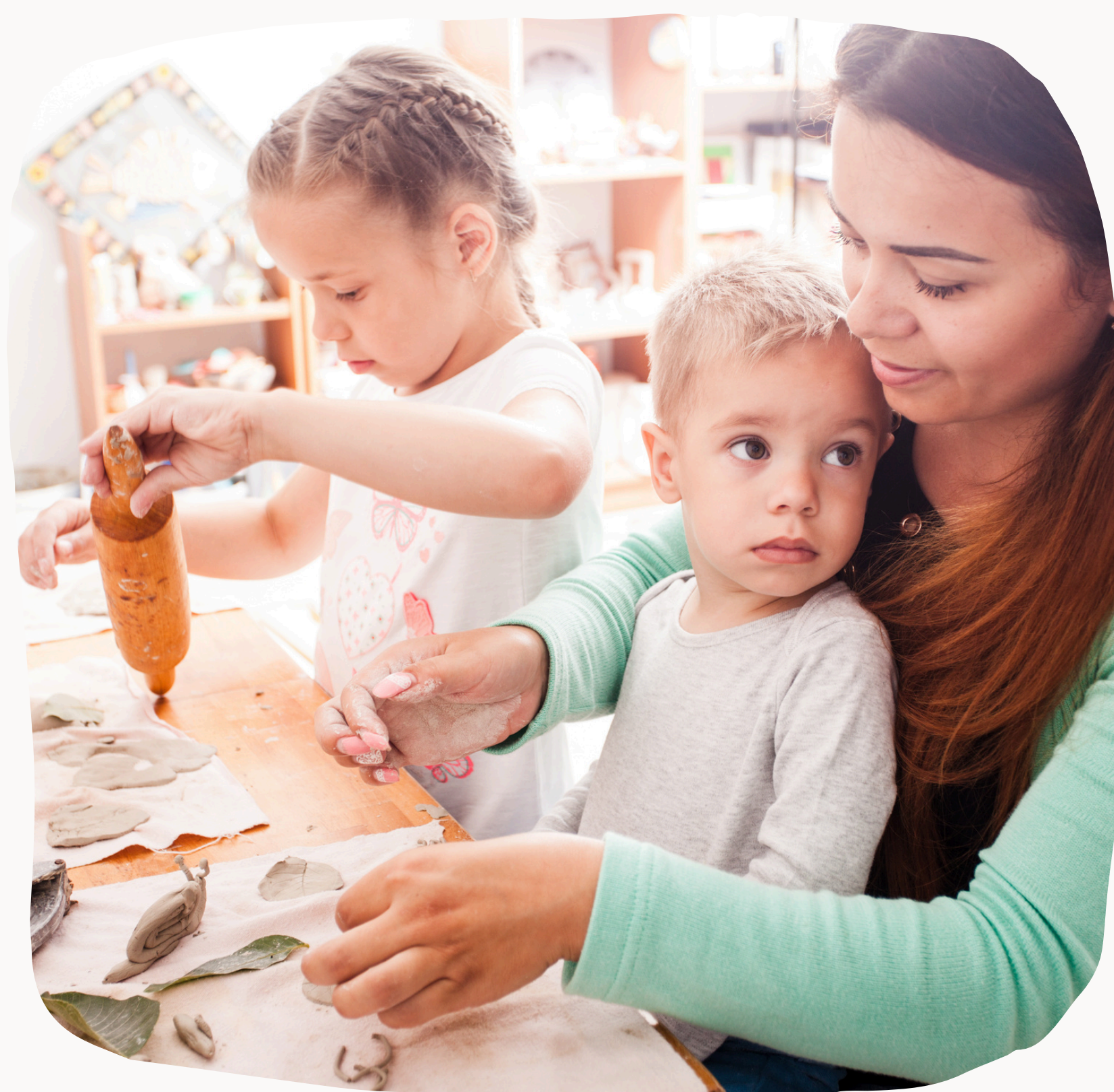
Schéma Départemental des Services aux Familles